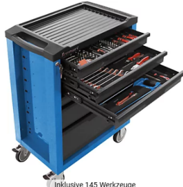
Inklusive 145 Werkzeuge

Zurück Start / Transportgeräte und Wagen / Werkzeugwagen / Werkzeugwagen inkl. 145 Werkzeugen