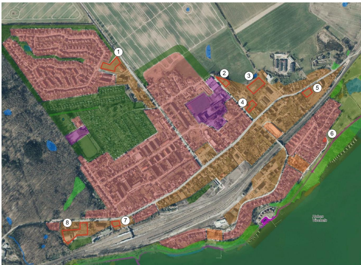
Abbildung 1: Überlagerung Luftbild der Siedlungslage Bad Kleinen (inkl. Biotope) mit ausgewiesenen Bauflächen gemäß dem wirksamen Flächennutzungsplan i. d. F. der 3. Änderung, Darstellung entwicklungsfähiger Wohnbauflächen (rot umrandete Flächen mit Nummerierung), o. M.