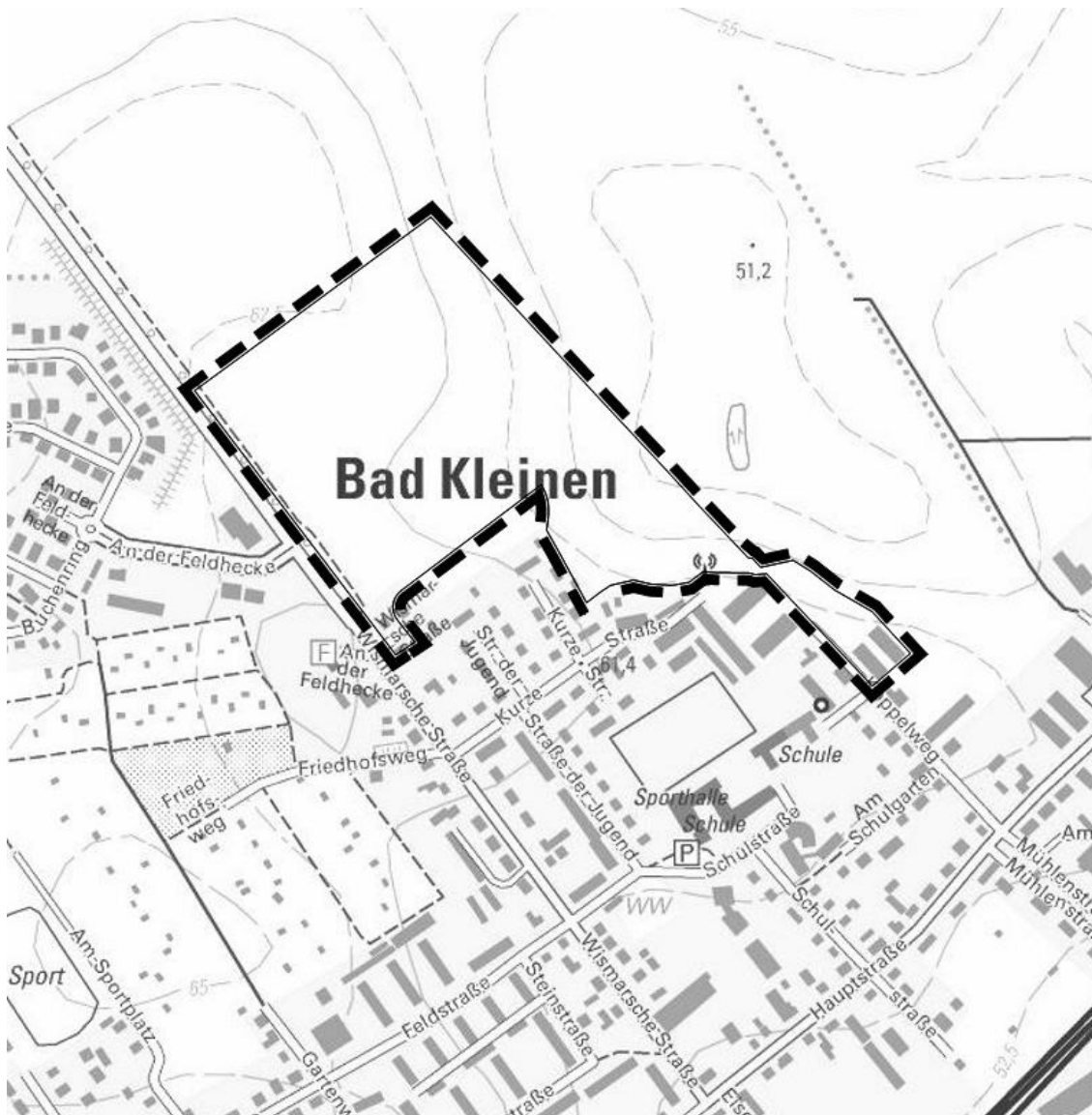
Auszug aus der digitalen topographischen Karte