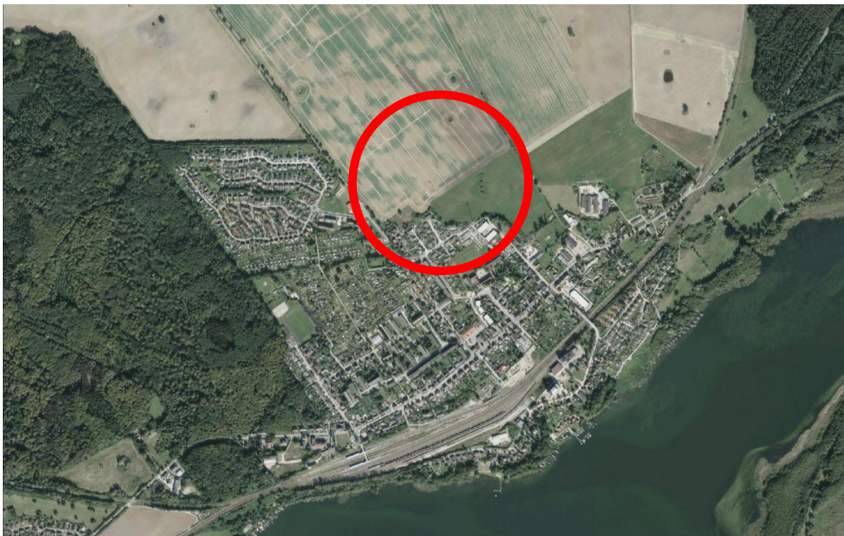
Abbildung 2: Luftbild mit Lage des Änderungsbereiches