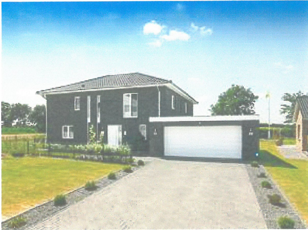
Beispielbilder (Anlage 1)