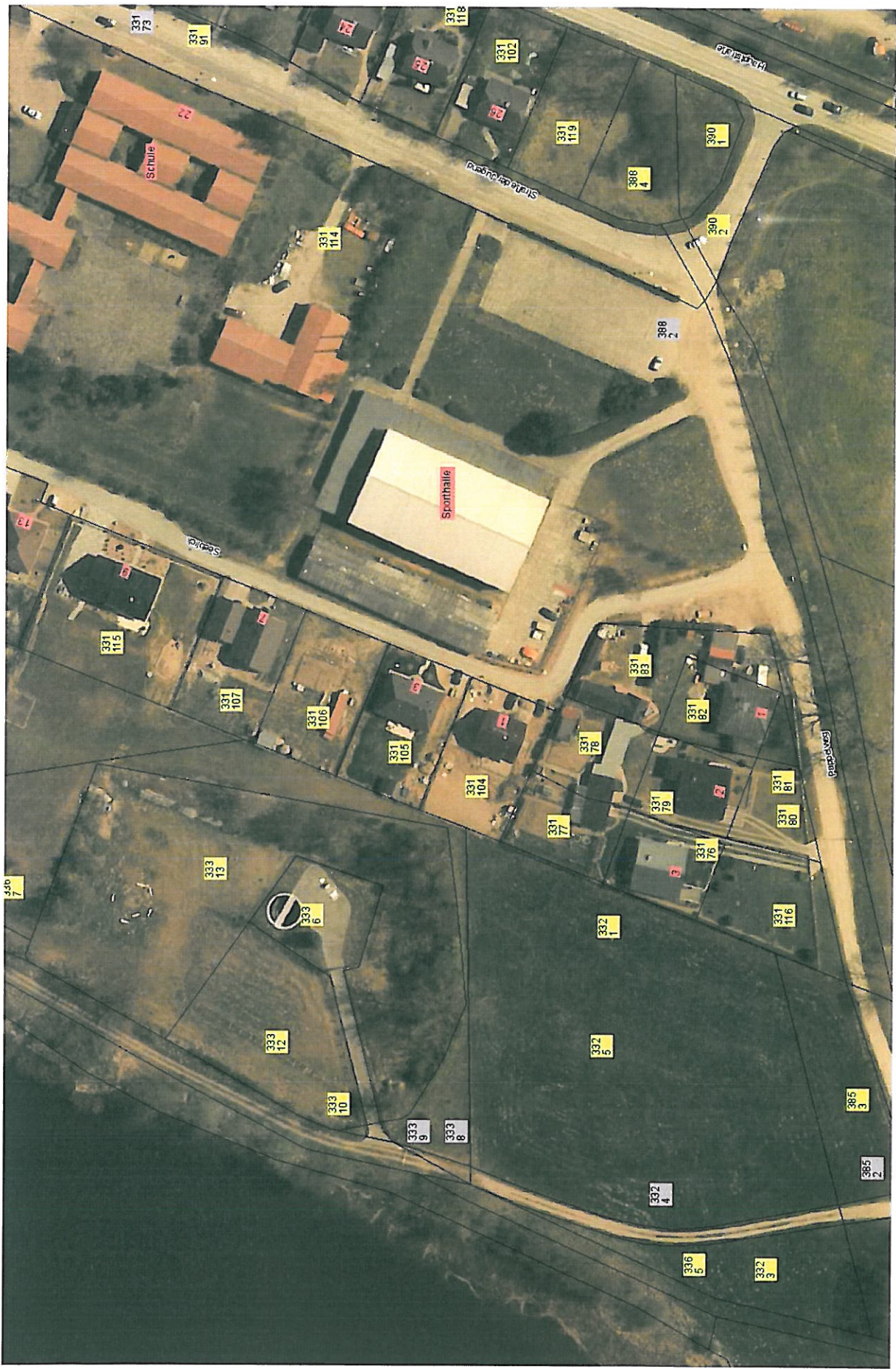
Gemarkung Ventschow Flur 1