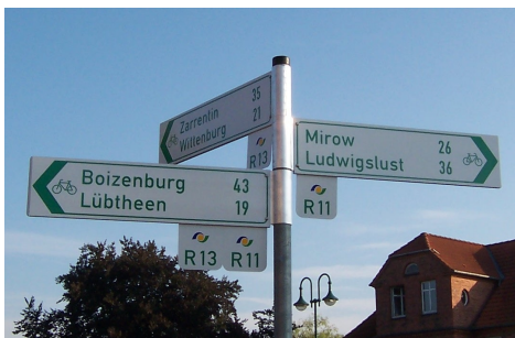
Abb. Beispiel Wegweisung

Die Beschilderung soll ein einheitliches Schildersystem vorweisen entsprechend dem Regionalen Radwegekonzept Westmecklenburg. Diese Wegweisung orientiert sich an den Gestaltungsgrundsätzen der Wegweisung am „Merkblatt zur wegweisenden Beschilderung für den Radverkehr“, herausgegeben von der Forschungsgesellschaft für Straßen- und Verkehrswesen (FGSV), und wurde mit dem ADFC (Allgemeiner Deutscher Fahrradclub) abgestimmt.